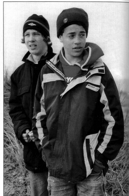
Pubertät ist, wenn die Erwachsenen schwierig werden...

Untersuchungen bestätigen, dass 70% aller Schülerinnen und Schüler überhaupt nicht an gewalttätigen Handlungen beteiligt sind – weder als Täter noch als Opfer oder Mitläufer. In der wissenschaftlichen Literatur geht man von 5% hoch aggressiver Schüler aus. Was sich in den letzten Jahren verändert hat, ist der Anteil der Mädchen in der Sekundarstufe I. Noch vor einigen Jahren kam auf zehn aggressive Jungen ein aggressives Mädchen (10:1) – inzwischen ermittelte man ein Verhältnis von 10:4. Auf Klassenfahrten ist mit Sicherheit verbal-aggressives Verhalten am häufigsten zu beobachten. Dabei sind die Lehrkräfte immer wieder erstaunt und schockiert darüber, welche Flut von Schimpfwörtern – vor allem mit sexu-